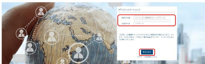
ビジネスポータル ログイン画面