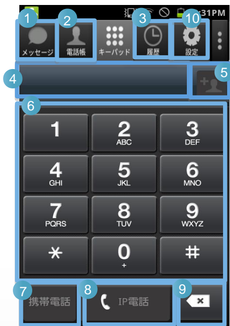
「050 plus」 キーパッド画面