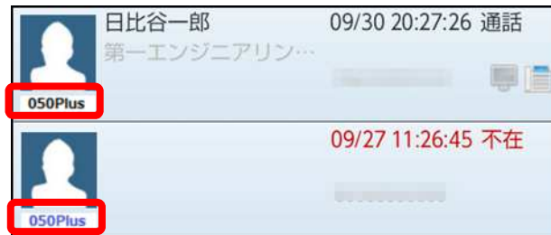
Web電話帳アプリ画面