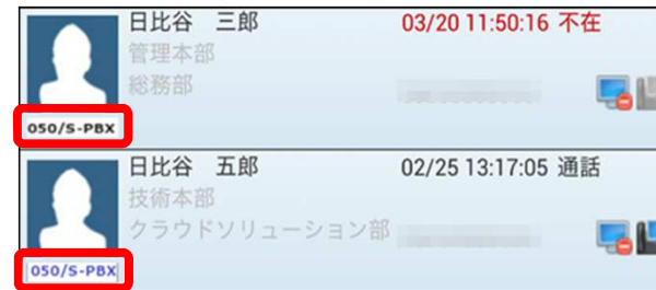
Web電話帳アプリ画面