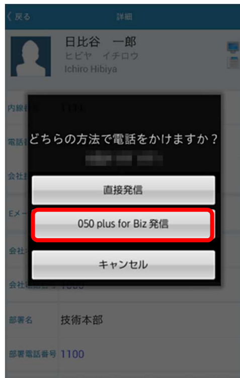
Web電話帳アプリ画面