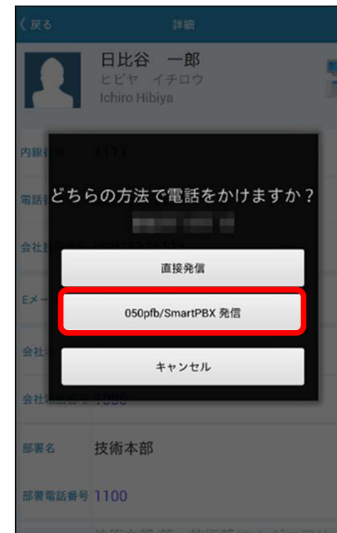
Web電話帳アプリ画面